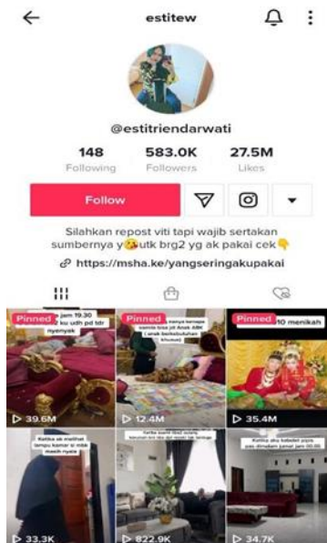
Gambar 1. Tampilan akun tiktok @estitew

Diantara contoh akun-akun media sosial yang mengunggah konten mengenai anak berkebutuhan khusus yang dibahas dalam penelitian ini adalah sebagai berikut : Pertama, akun tiktok dengan nama @estitew merupakan akun tiktok yang dikelola oleh orangtua yang membagikan informasi mengenai seorang anak bernama kamila yang mengalami cerebral palsy berat, dalam salah satu konten tiktoknya dicantumkan bahwa pada saat dipersalinan, kamila dilakukan beberapa kali induksi, dan pada saat pembukaan 5 ketuban ibu kamila dipecahkan sehingga aliran oksigen ke janin terganggu, detak jantung janin sangat lemah sehingga diputuskan untuk operasi sesar, tetapi janin sudah kritis. Diawal kehidupannya, kamila sangat tergantung dengan alat medis, dokter mengatakan jika kamila selamat, maka kamila akan mengalami cerebral palsy berat.