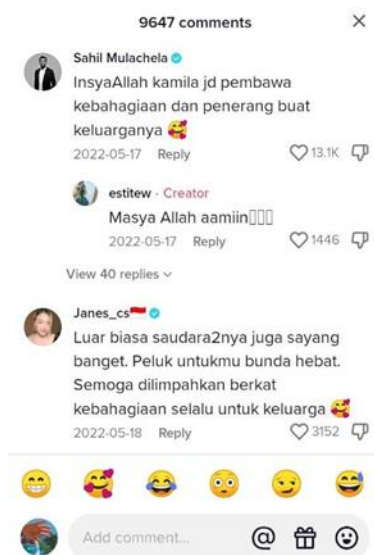
Gambar 2. Tampilan komentar akun tiktok @estitew

@estitew sering membagikan rutinitas atau keseharian orang tua dalam mengasuh anaknya yang berkebutuhan khusus. Kesabaran dan kegigihan orang tuanya membuat para netizen terharu sehingga memberikan pengaruh positif pada para pengikut (Followers) akunnya yang ditandai dengan banyaknya komentar positif, banyak warganet yang mendoakan yang baik terhadap kamila serta orangtuanya. Salah satunya, yaitu dari akun @Sahil Mulachela yang berkomentar "InsyaAllah kamila jd pembawa kebahagiaan dan penerang buat keluarganya"