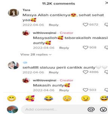
Gambar 8. Tampilan komentar pada akun tiktok @withloveqinsi