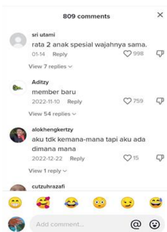
Gambar 7. Tampilan komentar pada akun @withloveqinsi

Upaya orangtuanya dalam mengenalkan dan memberikan informasi mengenai kelainan down syndrome kepada netizen, direspon kurang baik. Beberapa netizen ada yang menjadikan kelainan ini sebagai candaan, seperti komentar yang diberikan oleh akun @Aditzy yang berkomentar "member baru" Lalu ada juga dari akun @alokhengkertzy yang berkomentar "aku tdk kemana-mana tapi aku ada dimana mana".