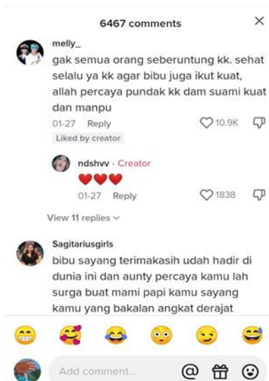
Gambar 5. Tampilan komentar pada akun tiktok @ndshv

Ketiga, akun tiktok milik @withloveqinsi, akun tersebut dikelola oleh orang tua dari qinsi yang merupakan anak yang memiliki kelainan genetik berupa down syndrome. Akun tersebut memiliki pengikut (followers) sebanyak 21,9 ribu pengikut. Akun tersebut sering kali membagikan konten mengenai keseharian anaknya dan juga perkembangan anaknya. Selain itu, akun ini sering kali membagikan pengetahuan atau pengenalan mengenai kelainan genetik yang dimiliki anaknya yaitu down syndrome, harapannya yaitu supaya bisa saling berbagi dan menghargai penyandang disabilitas.