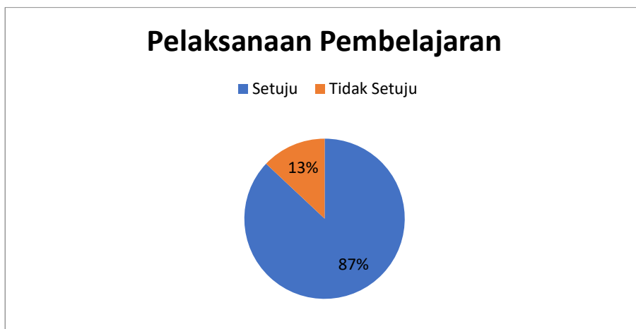
Gambar 2. Respon Siswa pada Pelaksanaan Pembelajaran Mata Pelajaran Pendidikan Agama Islam menggunakan aplikasi TikTok

Pada (Gambar 2) menunjukkan pelaksanaan pembelajaran Pendidikan Agama Islam menggunakan aplikasi TikTok menurut siswa SMA PGRI 1 Kotabumi. Dari data tersebut diketahui 87% siswa setuju dan 13% siswa tidak setuju. Berdasarkan data tersebut, kebanyakan siswa setuju jika pelaksanaan pembelajaran Pendidikan Agama Islam diselingi dengan menggunakan aplikasi TikTok.