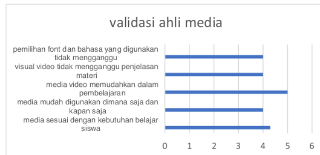
Diagram 2 validasi ahli media

Aspek 1, media sesuai dengan kebutuhan belajar siswa mendapatkan skor sebesar 4,3.