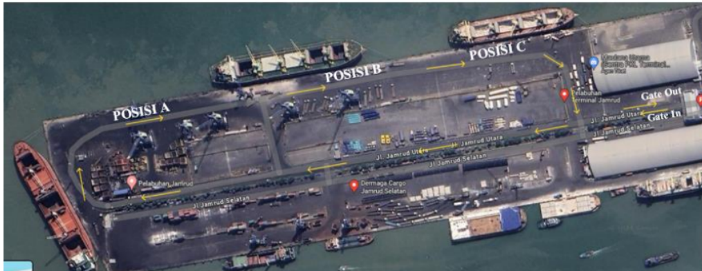
Gambar 1. Denah Pelabuhan

Untuk itu dalam pengukuran pengembangan Auto Gate System peneliti menggunakan indikator waktu tunggu efektif truk per menit dan kuantitas gate in dan gate out total per jam.