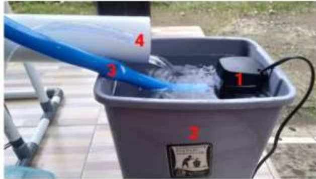
Gambar 3 Tandon dan pompa air

Salah satu komponen terpenting dalam hidroponik dengan menggunakan teknik NFT adalah pompa air. Pompa Hidroponik, adalah Pompa air sangat dibutuhkan untuk mengatur sistem penyaluran nutrisi ke instalasi hidroponik. Air yang berisi nutrisi dari penampungan diangkat memakai pompa air hidroponik dan dibagikan secara merata ke tanaman hidroponik.