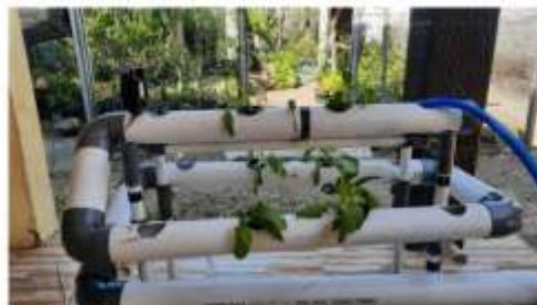
Gambar 2 Hidroponik NFT (Nutrient Film Technique)

Teknik hidroponik yang digunakan dalam penelitian ini yaitu teknik NFT (Nutrient Film Technique). Sistem hidroponik NFT mensirkulasi air dengan menggunakan metode genangan dan kemiringan pipa pralon sehingga air mengalir sampai bawah.