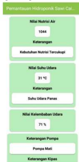
Gambar 4 Pemantauan Nilai Sensor di Android Secara Realtime

Untuk memudahkan pemantauan penulis menggunakan aplikasi android. Hasil pemantauan tersebut dapat dipantau pada menu monitoring.