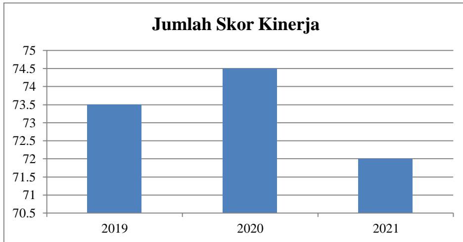
Gambar 1.2 Penilaian Kinerja Karyawan Tahun 2019-2021

Berdasarkan Gambar 1.2 data menunjukkan bahwa pada tahun 2019 persentase kinerja karyawan dengan skor kinerja karyawan 73,5%. Tahun 2020 untuk skor kinerja mengalami peningkatan dengan persentase sebesar 74,5%. Namun pada tahun 2021 kembali mengalami penurunan yaitu dengan persentase 72%. Melalui data di atas dapat disimpulkan bahwa hasil kinerja karyawan tahun 2018 paling rendah dan menunjukkan hasil rata-rata kinerja karyawan yang belum optimal.