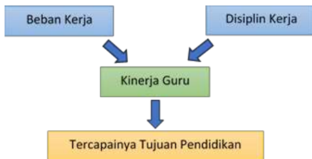
Gambar 1. Kerangka Berpikir

Kerangka berpikir dari penelitian ini bahwa beban kerja dan disiplin kerja berpengaruh terhadap kinerja guru, yang mana kinerja guru dibutuhkan untuk mencapai tujuan pendidikan.