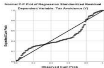
Gambar 2 Hasil Uji Normalitas P-Plot

Uji normalitas dilakukan dengan tujuan untuk menguji apakah dalam model regresi, variabel pengganggu atau residual memiliki distribusi normal atau tidak. Model regresi yang baik adalah data yang normal pendistribusiannya. Data dalam penelitian ini menggunakan uji Normal P-P Plot of Regression Standardized Residual dan One Sample Kolmogorov Smirnov. Terdapat dasar pengambilan keputusan yaitu jika data menyebar di sekitar garis diagonal dan mengikuti arah garis diagonal atau grafik histogramnya menunjukkan pola distribusi normal, maka model regresi memenuhi asumsi normalitas. Jika data menyebar jauh dari garis diagonal dan atau tidak mengikuti arah garis diagonal atau grafik histogram tidak menunjukkan pola distribusi normal, maka model regresi tidak memenuhi asumsi normalitas. Hasil pengujian dengan menggunakan analisis grafik Normal P-P Plot Of Regression Standardized Residual dapat dilihat pada gambar berikut ini: