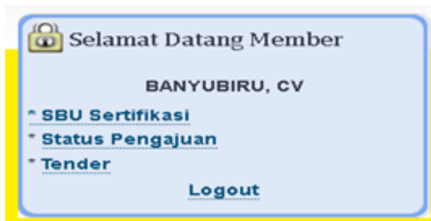
Gambar Cek Status