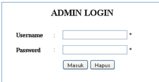
Gambar Form Login Admin