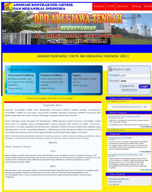
Gambar Menu Utama