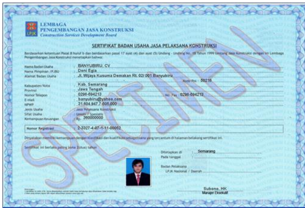
Gambar Laporan Hasil SBU