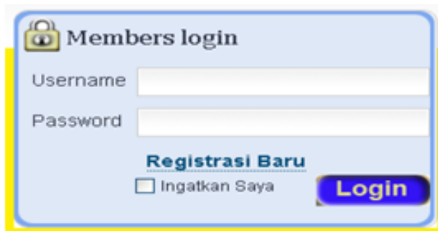
Gambar Menu Login