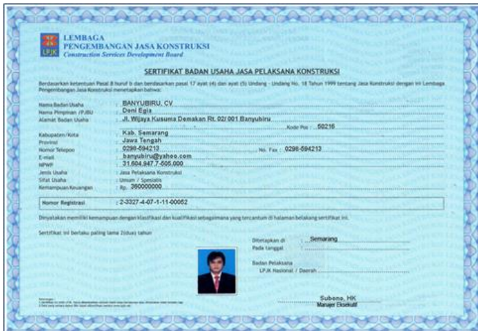
Gambar Hasil SBU