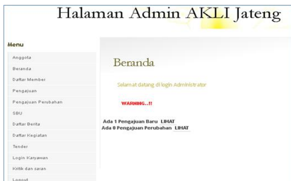
Gambar Halaman Admin