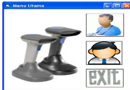
Gambar 1 Tampilan Menu Utama

Tampilan gambar di atas terlihat pada saat pertama kali aplikasi dijalankan. Ada 3 pilihan gambar yang bisa dipilih yaitu :