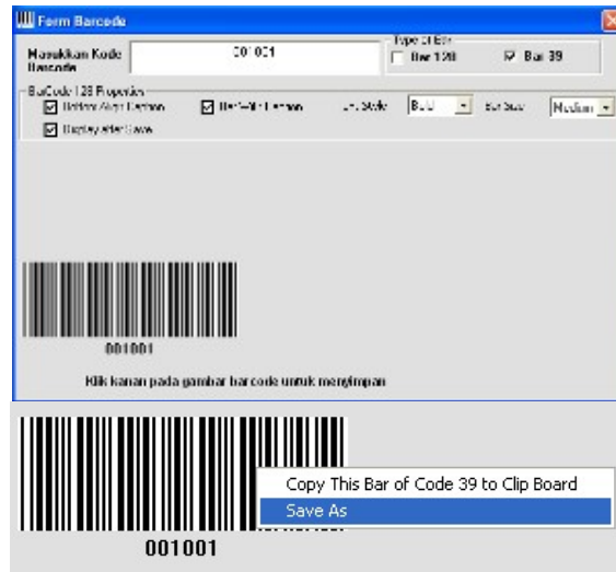
Gambar 6 Tampilan Form Barcode

Form barcode digunakan untuk mendapatkan gambar barcode sesuai dengan NIK karyawan. Untuk menyimpan gambar klik kanan pada gambar barcode kemudian pilih “save as”. Simpan gambar pada folder image yang berada pada folder aplikasi dengan format “bmp”.