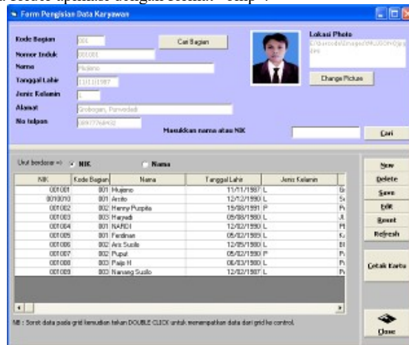
Gambar 7 Tampilan Form Input Aturan

Form barcode digunakan untuk mendapatkan gambar barcode sesuai dengan NIK karyawan. Untuk menyimpan gambar klik kanan pada gambar barcode kemudian pilih “save as”. Simpan gambar pada folder image yang berada pada folder aplikasi dengan format “bmp”.