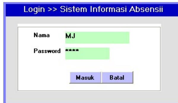
Gambar 3 Tampilan Form Login

Untuk memulai absensi harus memilih dulu option “Absen Masuk” atau “Absen Pulang” , kemudian tembakkan alat barcode ke arah kartu absensi. Jika NIK dikenal akan muncul gambar foto karyawan yang sudah disimpan dalam database. Proses ini akan langsung menyimpan informasi absensi yang telah dilakukan sesuai tanggal dan jam.