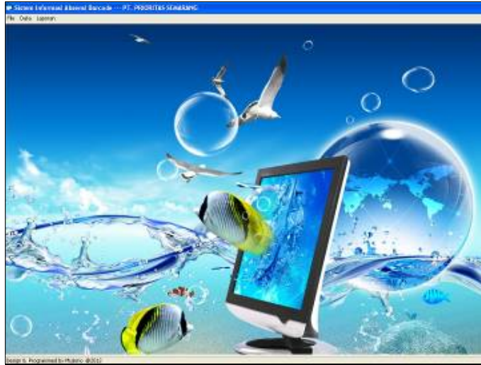
Gambar 4 Tampilan Halaman Administrator