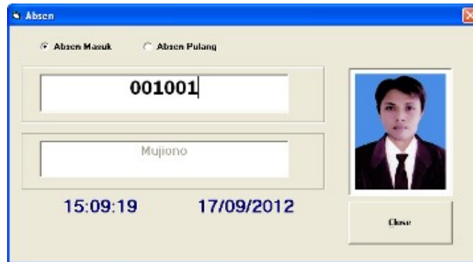
Gambar 2 Tampilan Form Absensi

Jika memilih gambar pertama akan muncul tampilan seperti di bawah ini.