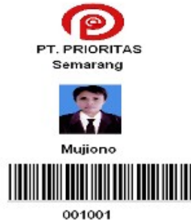
Gambar 8 Kartu Absensi Karyawan