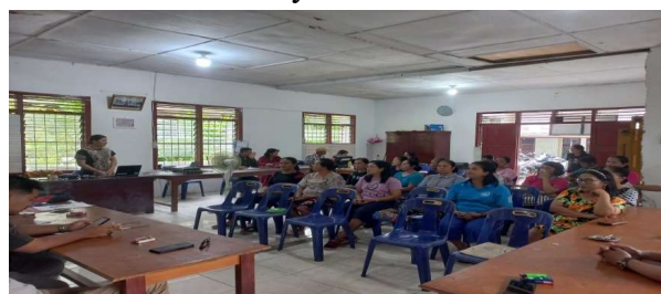
Gambar 3 Musyawarah Desa Tumori

Kecekatan pemerintahan untuk menemukan kebutuhan publik, membuat rencana peningkatan pelayanan, dan membuat program kepada masyarakat yang sesuai dengan kebutuhan dan harapan rakyat Dikutip dari Dwiyanto dalam Abdurahman J (2017) . Setelah mengumpulkan informasi berupa fakta dan data yang tercipta dari komunikasi internal pemerintah desa Tumori juga melakukan langkah atau metode evaluasi dengan musyawarah desa yang bertujuan untuk menyerap aspirasi masyarakat dalam menentukan arah kebijakan dan program yang akan dijalankan berikut dokumentasi yang telah dilakukan peneliti.