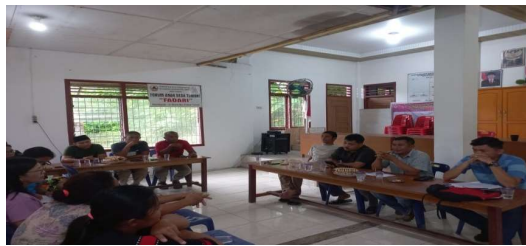
Gambar 2 Rapat Pemdes

semua bidang kinerja yang telah ditugaskan. Pemimpin dan atasan harus bertanggung jawab atas semua tindakan pegawai untuk mendorong dan memotivasi mereka dalam mencapai kinerja yang produktif. Begitu pula dengan pemerintahan desa Tumori yang mencoba membangun komunikasi yang baik serta hubungan interpersonal antara kepala desa sebagai pimpinan dan perangkat desa sebagai bawahan yang mempunyai beban tugas masing masing. Dalam menjalin komunikasi yang aktif pemerintahan desa selalu melakukan rapat internal secara rutin setiap minggunya untuk mengumpulkan informasi yang telah di dapatkan dan perlu untuk disampaikan terkait jalannya program-program desa ini sejalan dengan studi pustaka terkait penelitian bahwa pimpinan harus bertanggung jawab atas semua tindakan pegawai untuk mendorong dan memotivasi mereka dalam mencapai kinerja yang positif berikut dokumentasi yang dilakukan oleh peneliti :