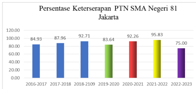
Gambar 1. Persentase Keterserapan PTN SMA Negeri 81 Jakarta

Berdasarkan observasi awal yang dilakukan penulis di SMA Negeri 81 Jakarta Timur didapatkan data mengenai siswa yang lulus melalui jalur PTN dalam 3 tahun terakhir yaitu: pada tahun 2020-2021, 2021-2022, 2022-2023.